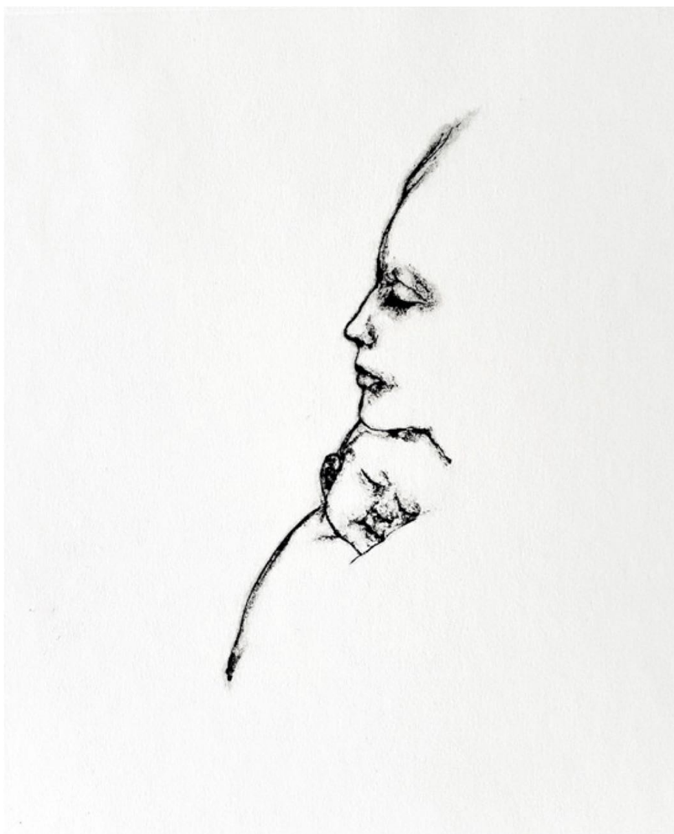
Ametza / Sueño (2015)

Alkograbatua. 25 x 30 cm-ko matrizea. Alcograbado. Matriz de 25 x 30 cm.