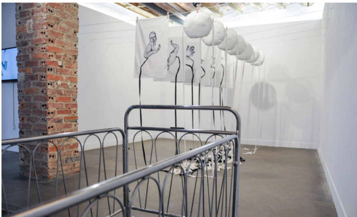
Ixo / Calla, calla (2016) Altzairuzko sehaska, kotoi, kerpa eta guatazko oihalaren gainean inprimatutako alkograbatua. Dimentsio aldakorak. Cuna de acero, alcograbado impreso sobre tela de algodón, cintilla y guata. Dimensiones variables.

El «robo de bebés» en el Estado español constituye uno de los episodios más oscuros de nuestra historia reciente. El franquismo convirtió la maternidad en una cuestión de Estado. Lo que comenzó con la segregación de las hijas e hijos de las mujeres presas en las cárceles franquistas, como medida de higiene racial postulada por el psiquiatra Antonio Vallejo Nágera, se extendió durante al menos seis décadas, hasta bien entrada la democracia, afectando a un número incalculable de mujeres. Muchas de ellas caminan entre nosotras, aunque no las veamos. O no se las quiera ver. Son víctimas de un crimen de género y de un crimen de Estado, pero por encima de todo son grandes luchadoras que no tiran la toalla.