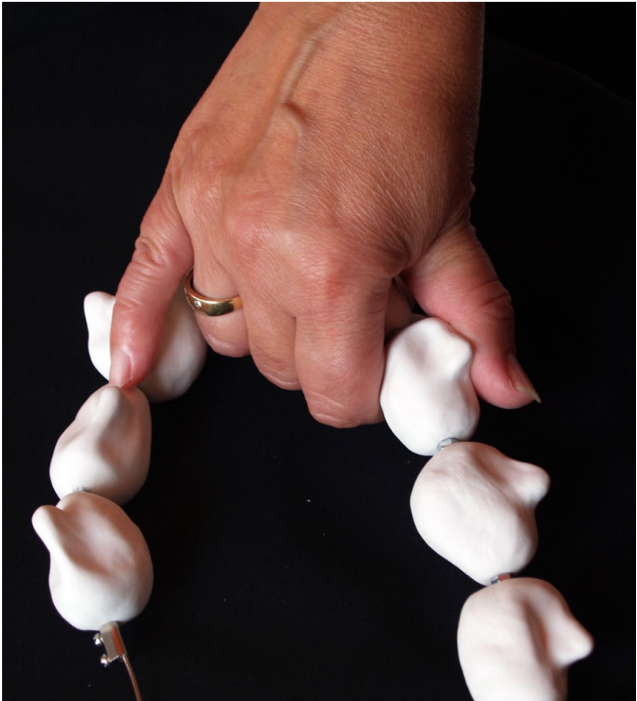
Rosario (2011) Portzelana eta altzaria. Dimentsio aldakorak. Porcelana y acero. Dimensiones variables.