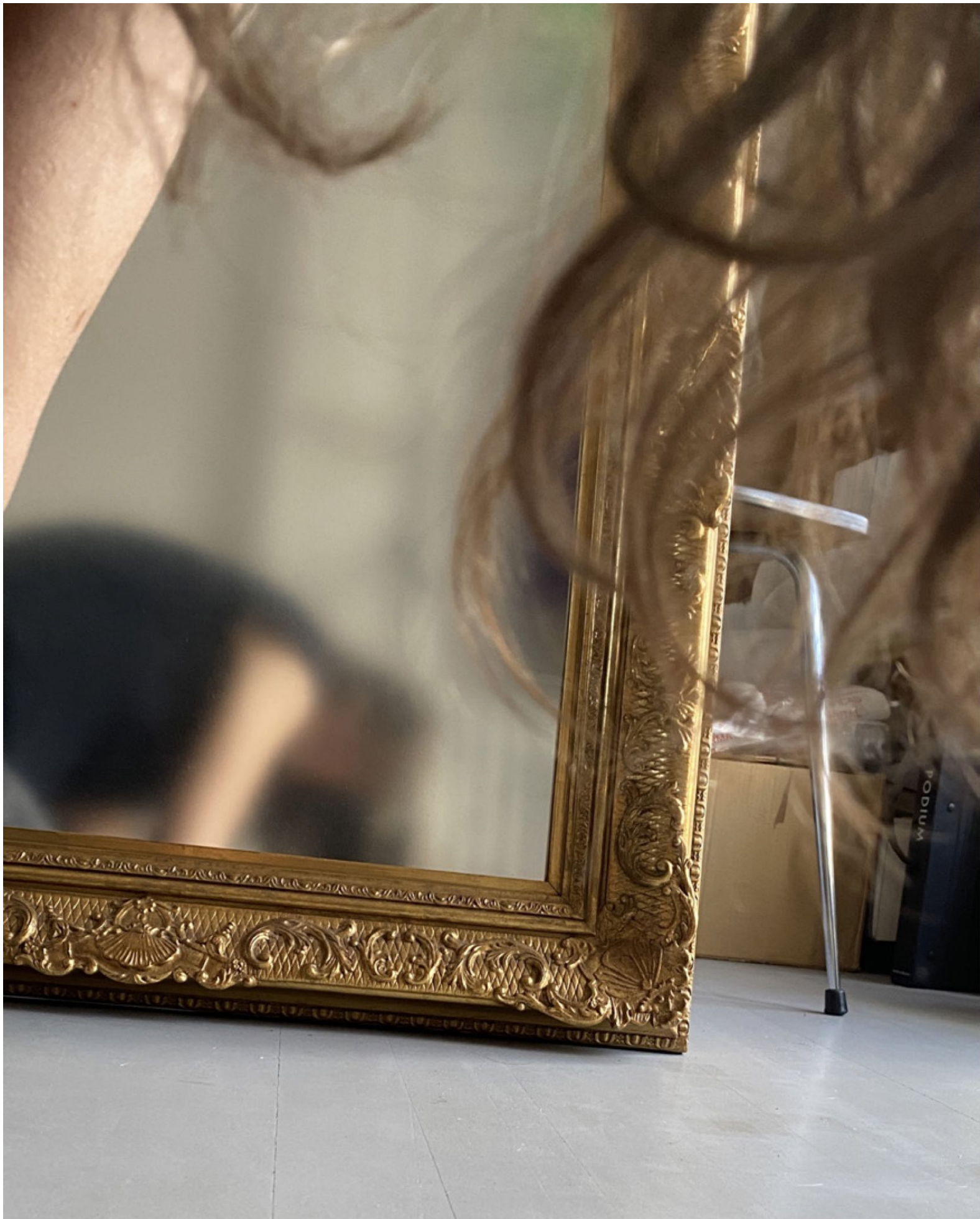
Nortasuna / Identidad (2008) Ispilua eta kristala. 86 x 76 cm. Espejo y cristal. 86 x 76 cm.