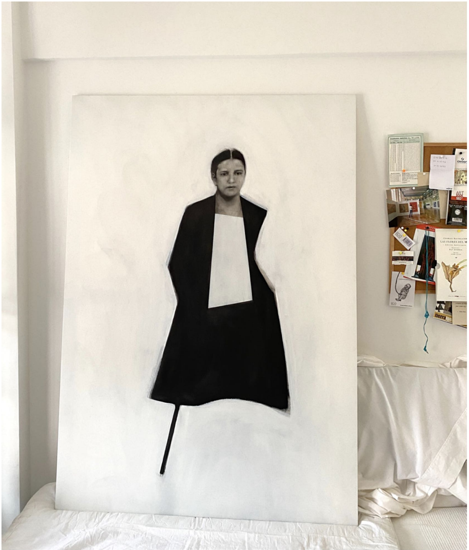
Memoria (2007-2008) Ikatza, pastela eta grafitoa mihise gainean. 162 x 114 cm. Carbón, pastel y grafito sobre lienzo. 162 x 114 cm.