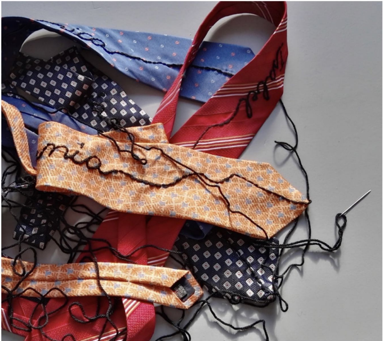
Trapu zaharrak / Trapos sucios (2016tik / Desde 2016) Gorbatak, artile zantzuak, egurrezko pintzak. Dimentsio aldakorak. Corbatas, hebras de lana, pinzas de madera. Dimensiones variables.