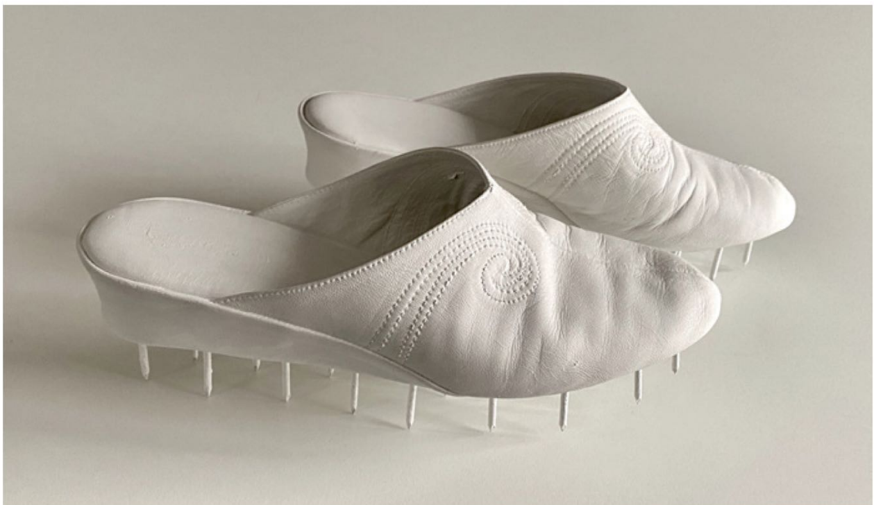
Maruja (2020) Zapatilak, altzairua, akrilikoa eta egurra. Dimentsio aldakorak. Zapatillas, acero, acrílico y madera. Dimensiones variables.

cribando, cumpliendo expectativas, defraudando, pisando flecos y sorteando cristales cuando reparamos en ellos. Aprendemos de la erosión, del derrumbe, del ahogo de la culpa, del lienzo en blanco, de la llamada equivocada, de escoger lo que no debemos, de la inercia que no cambia, del arrepentimiento por no haber hecho, por no haber dicho, por no haber podido. Aprendemos de las cuentas pendientes. Siempre. Contra viento y marea.