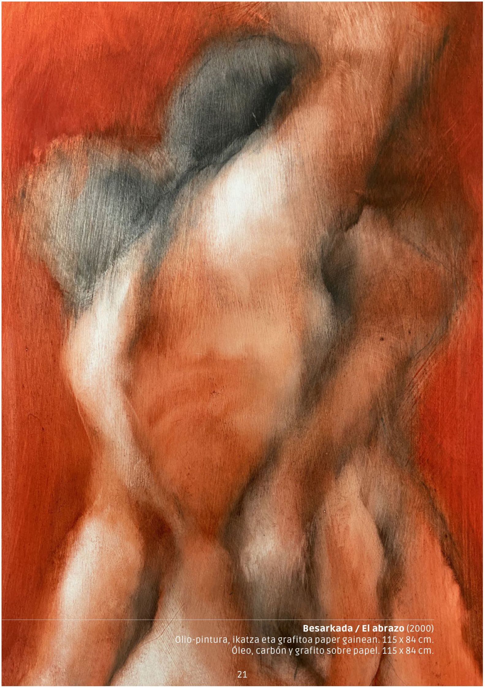
Besarkada / El abrazo (2000) Olio-pintura, ikatza eta grafitoa paper gainean. 115 x 84 cm. Óleo, carbón y grafito sobre papel. 115 x 84 cm.