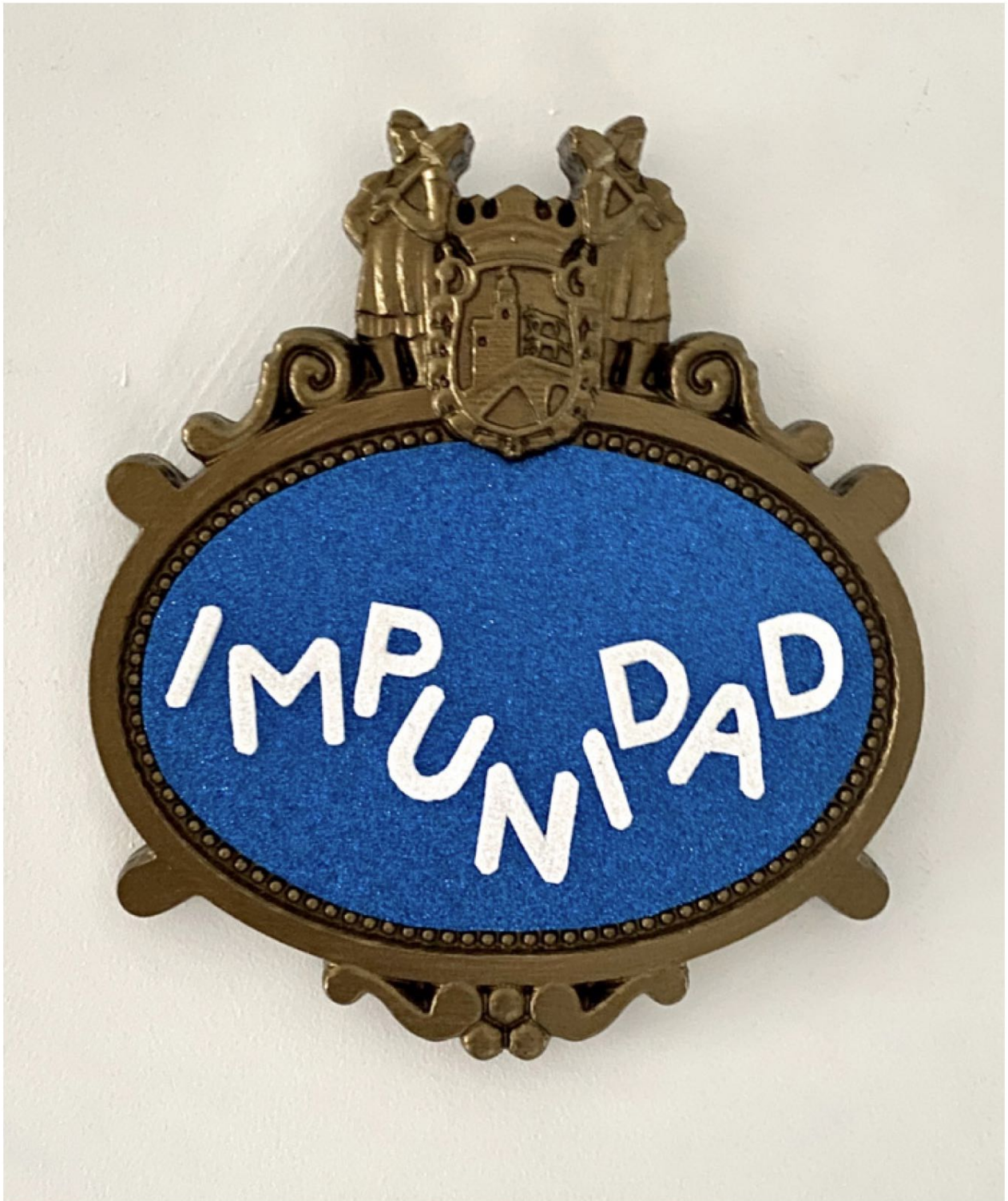
Plaka / Placa (2022) Erretxina akrilikoa eta EVA goma. 21 x 18 cm. Resina acrílica y goma EVA. 21 x 18 cm.