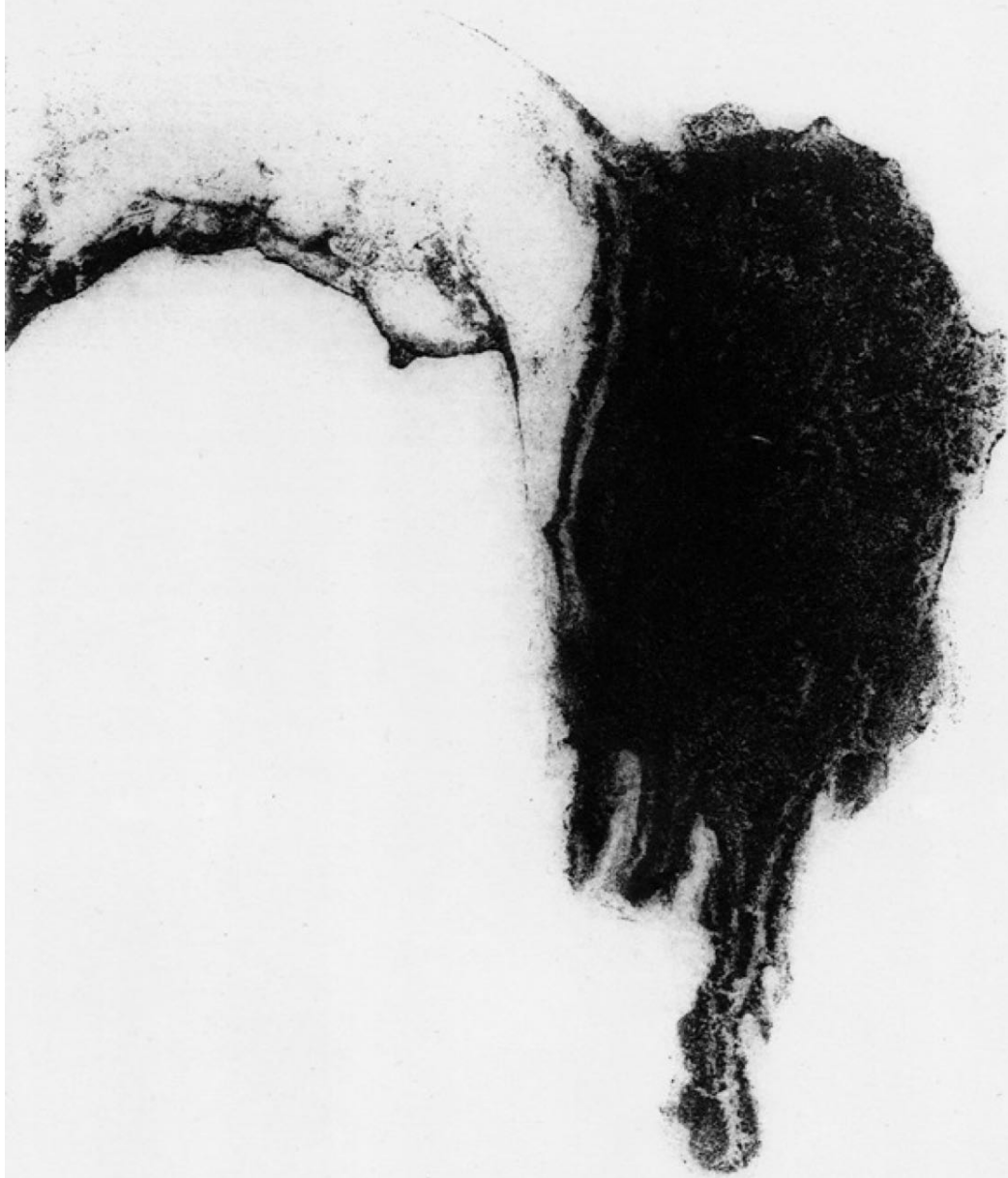
Tanta / Gota (2009) Alkogradatua. 25 x 20 cm-ko matrizea. Alcogradado. Matriz de 25 x 20 cm.