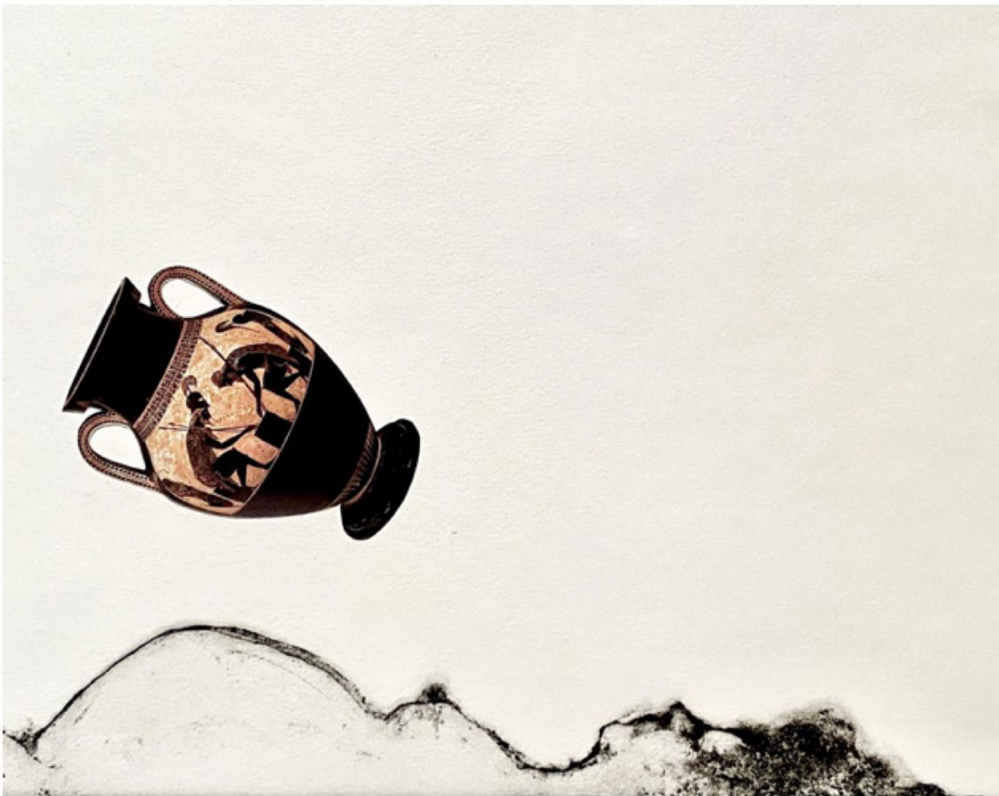
Pinotxo / Pinocho (2013) Alkograbatua. 20 x 25 cm-ko matrizea. Alcograbado. Matriz de 20 x 25 cm.