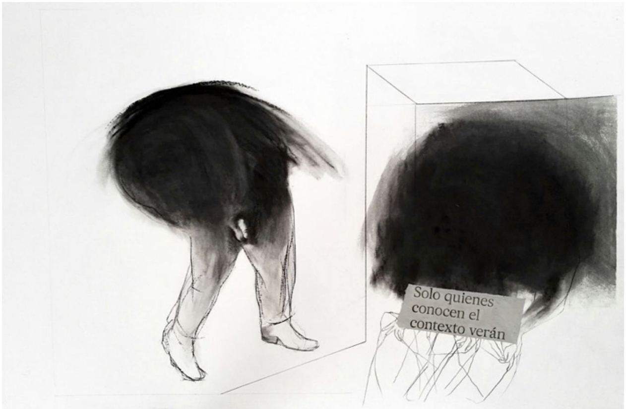
Hamaika aldiz ez / Once veces no (2020-2011) 24 x 19 cm-ko matrize batetik egindako 22 alkograbatuz osatutako multzoa. Serie de 22 alcograbados realizados a partir de una matriz de 24 x 19 cm.